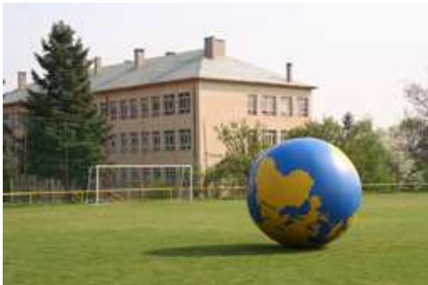
Osamělá zeměkoule uprostřed fotbalového hřiště