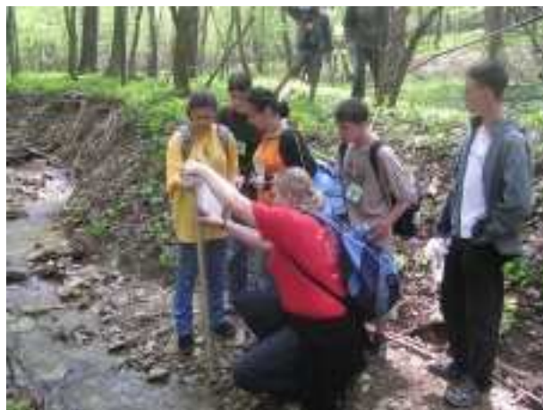
DEERS taking hydrological measures