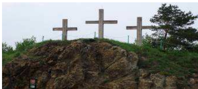
Skalní útvar Hrádek