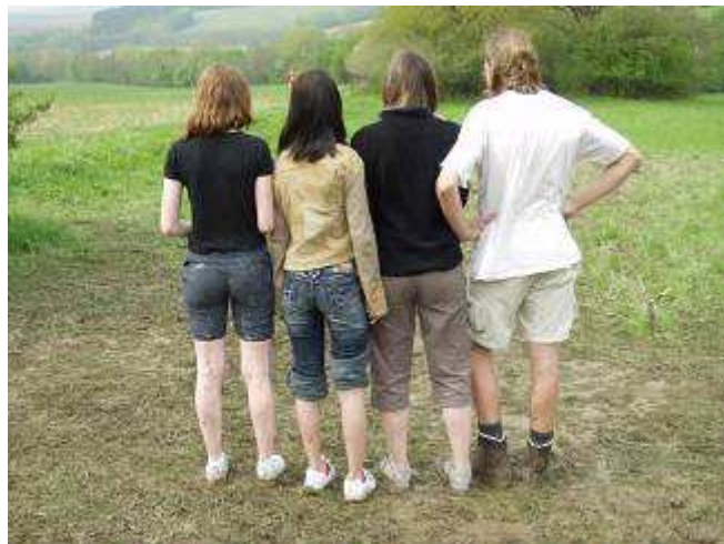
Pozadí čtyř odvážných po úspěšném absolvování stanoviště „klávesnice“