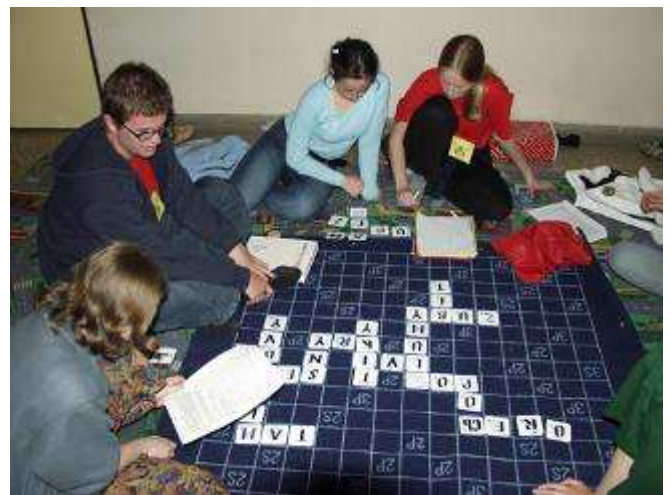
Písmenka nejen v první třídě – hra scrabble